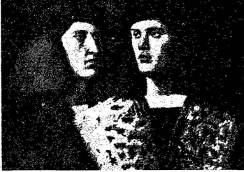
Giovanni Bellini's 'Portretten' (Berlijn); veejoren?

TOT de, althans voor de cultuur, meest catastrofale gevolgen van de 'absolute' oorlog behoort wel de vernieling van het gehele Duits museumwezen het levenswerk van Dr. Wilhelm von Bode en dr. Max Friedländer; een verlies dat niet alleen Duitsland treft, maar in steeds toenemende mate door de gehele beschafte wereld zal worden besef. Het is eerst nu — vijf jaren na het einde van de oorlog — mogelijk om de gevolgen in hun geheel te overzien.